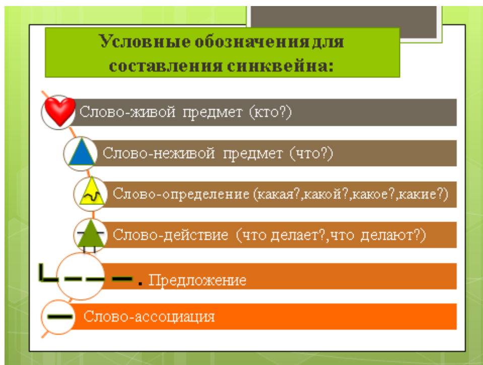
рис.7 «Елочка синквейна» и опорная схема синквейна с условными обозначениями