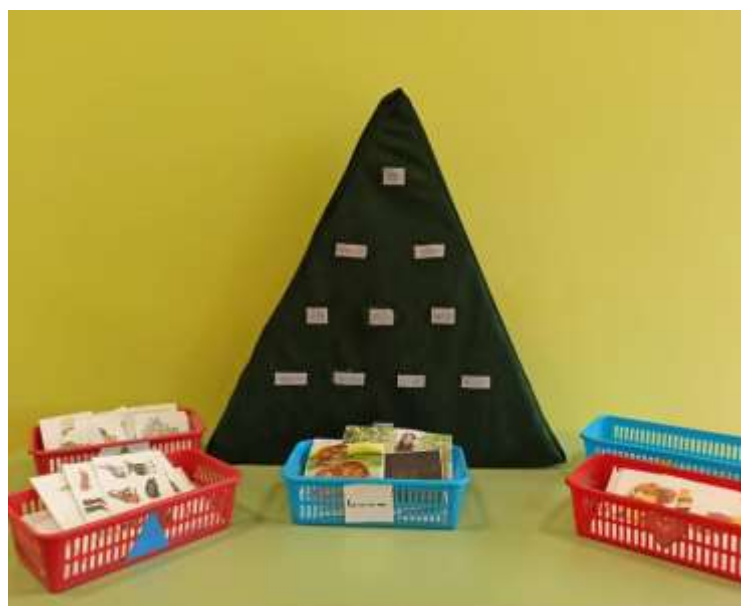
рис.5 «Правила составления синквейна»